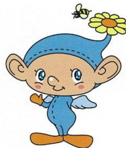
マスコットキャラクター「イズミちゃん」