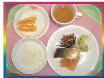
《ふだんの日のメニュー》